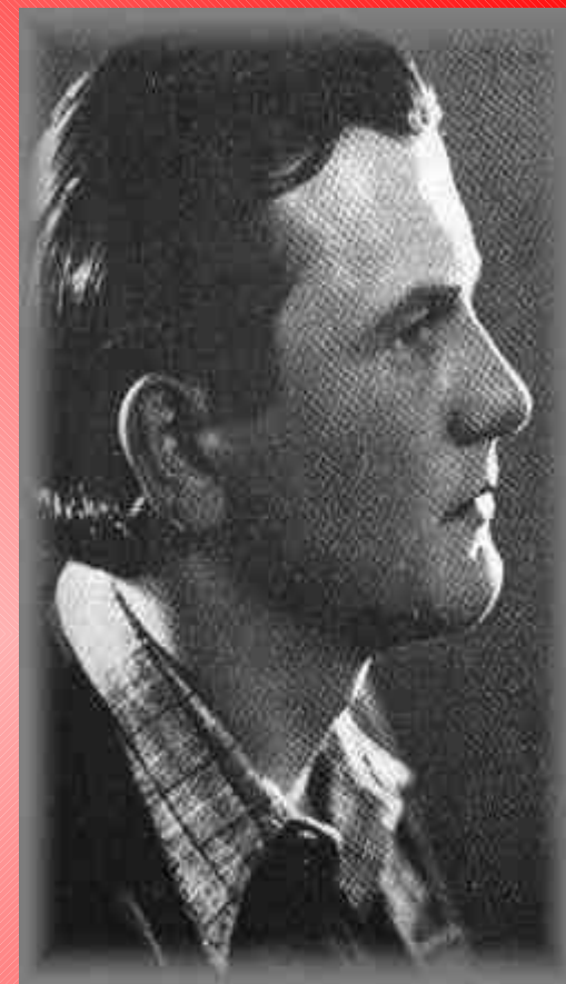
Karol Wojtyła po maturze Wadowice 1938