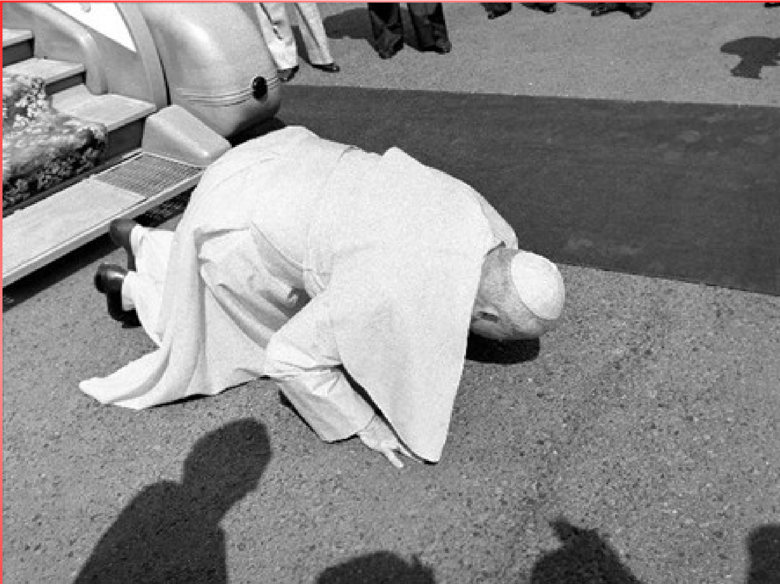
Jan Paweł II całuje polską ziemię, po przylocie do Ojczyzny