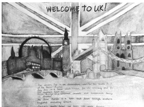
Praca Poli Krzyżok